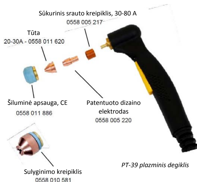
PT-39 plazminis degiklis

2013-01-16 / ESAB pasilieka teisę pakeisti techninius duomenis be išankstinio įspėjimo